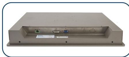
QY-F190-S 产品侧面 1