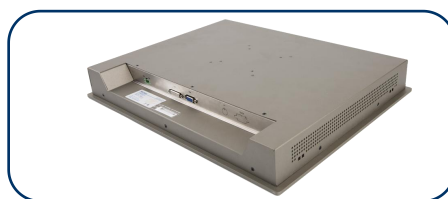
QY-F190-S 产品侧面 3