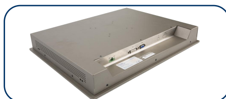
QY-F190-S 产品侧面 2